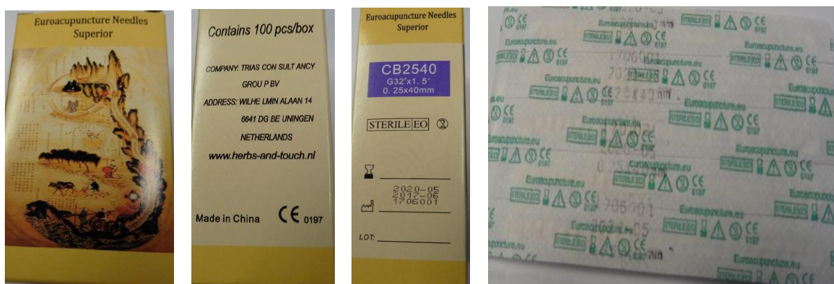
2. Agulhas estéreis para acupunctura do fabricante Trias Consultancy Group BV