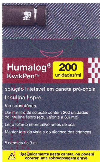
Cartonagem exterior da Humalog 200 unidades/ml KwikPen